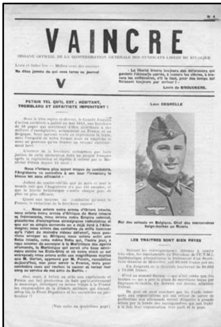
Journal clandestin Vaincre, n°4 (EAR)

clus du ravitaillement officiel, - du fromage, par exemple - mais quoi que fassent les autorités d'occupation d'une part en faveur des mineurs et quelques autres catégories d'ouvriers dont la production est d'un intérêt vital pour la guerre d'Hitler, et les grands employeurs d'autre part, seuls ceux qui travaillent dans les entreprises visées profitent des avantages et en regard de la masse de la population, ils ne représentent qu'une assez faible minorité.