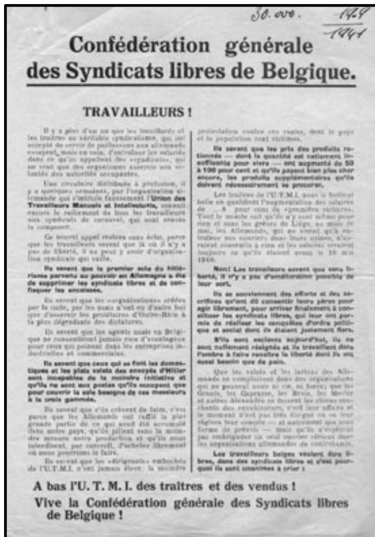
Tract de la Confédération générale des syndicats libres de Belgique, 19 septembre 1941 (FAR)

La preuve, c'est qu'ils ont été plusieurs fois modifiés suivant les réactions qui nous parvenaient de l'un ou l'autre endroit.