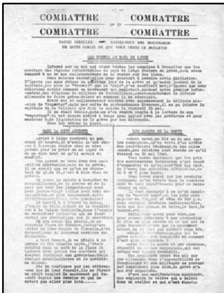
Journal clandestin Combattre, n°17 (FAR)

Pour me rassurer sur son geste, dont il avait discuté avec ses amis, il ajouta immédiatement que les bénéficiaires n'auraient aucune espèce d'engagement à prendre et qu'ils seraient absolument libres, après comme avant, d'agir suivant leurs convictions.